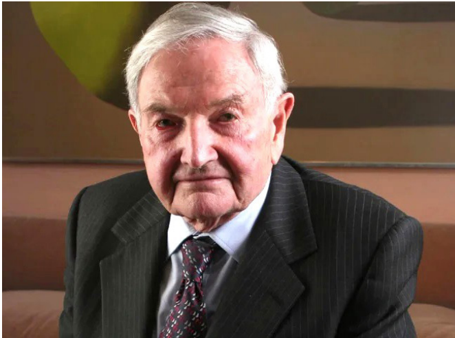
David Rockefeller, uno de los prominentes fundadores del Club Bilderberg.

En 1952 funda el Consejo de Población 10 (CP), de orientación maltusiana, que parte de la idea de que la población mundial debe